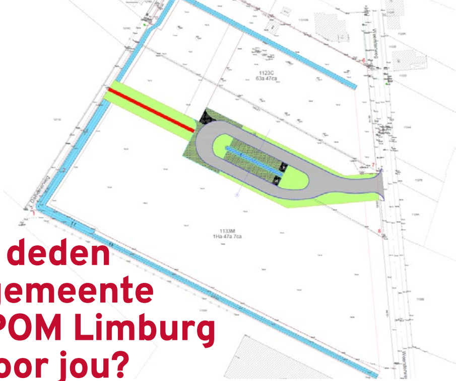
Plan van de wegenis en de grachten

Door de keuze voor centrale parkeerplaatsen mogen bedrijven op eigen terrein geen parkeerplaatsen meer aanleggen . Alleen de inrit naar de toegangspoort(en), en de strikt noodzakelijke verharding voor het