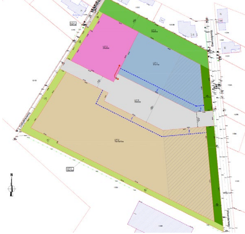
Plan avec les zones de projet